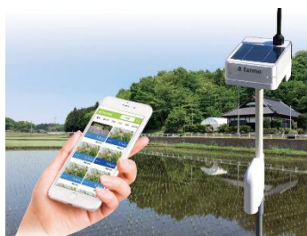
【今やスマホで田の水位管理だそうです！】

一関市は農業生産額が県1位、東北2位、全国16位と、大変農業が盛んなのですが、人口減少、農業従事者の高齢化に伴い、農業の効率化が求められているのだそうです。