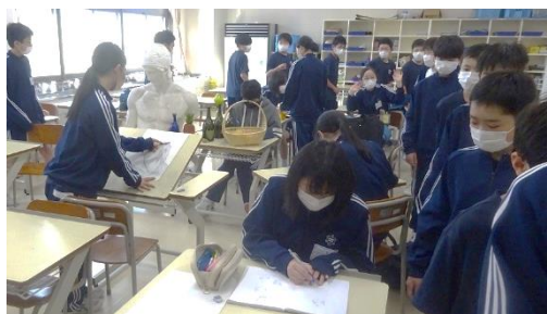
【市内でも珍しい美術部を見学する1年生】